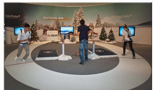
Statt auf Crosstrainern kann die Belastung auch z.B. durch Laufen erfolgen. Die Zeiten werden dann durch Druck auf einen Buzzer gestoppt.