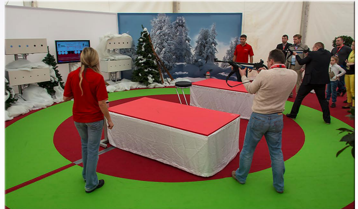
Auf Wunsch liefern wir eine Winterdeko gleich mit dazu.

Die verwendete Waffe, ein Lichtgewehr, fällt nicht unter das Waffengesetz. Auch Kinder dürfen damit schießen. „Echte“ Schussgeräusche sorgen für die passende Biathlonatmosphäre.