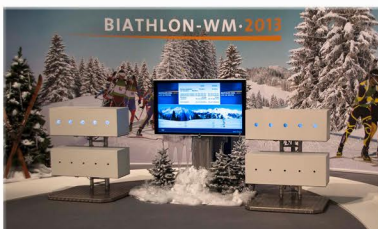
Die Zielanlagen mit Tag- u. Nachtmodus sind wetterfest.