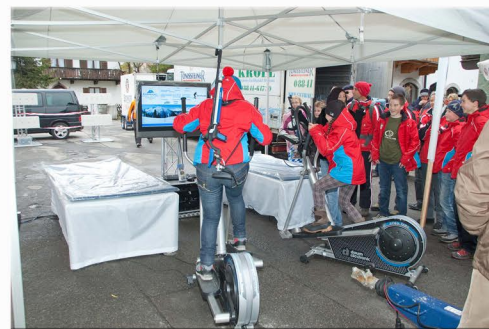
Das Laufen auf einem Crosstrainer kommt dem auf echten Skiern sehr nah.